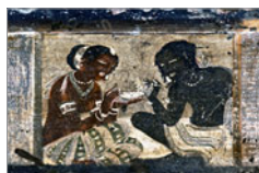
Höhlen von Ajanta