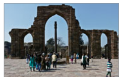
eiserne Vishnu-Säule Delhi