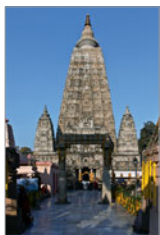
Mahabodi-Tempel Bodh Gaya

Einwanderung arischer Stämme aus Zentralasien