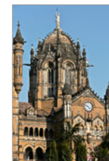
Victoria Terminus Mumbai