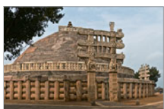
Stupa von Sanchi

Chandragupta (321–297) Ashoka (269 – 232 v. Chr.) Förderer des Buddhismus