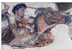
Alexander der Große erreicht den Indus

< Induskultur (ca. 2600–1750 v. Chr.) erste städtische Kultur